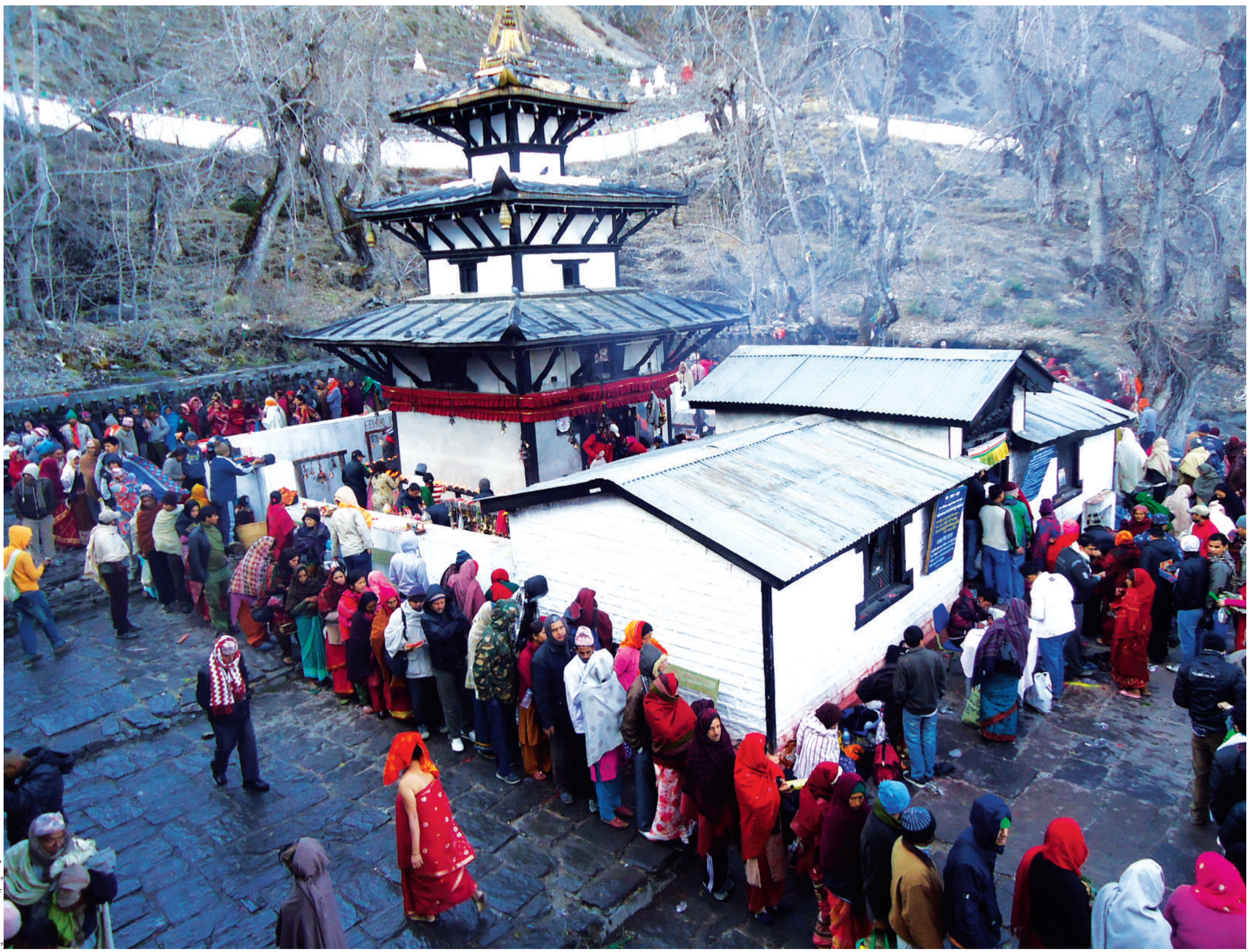
सुदूरपश्चिम प्रदेश, मुस्ताङ