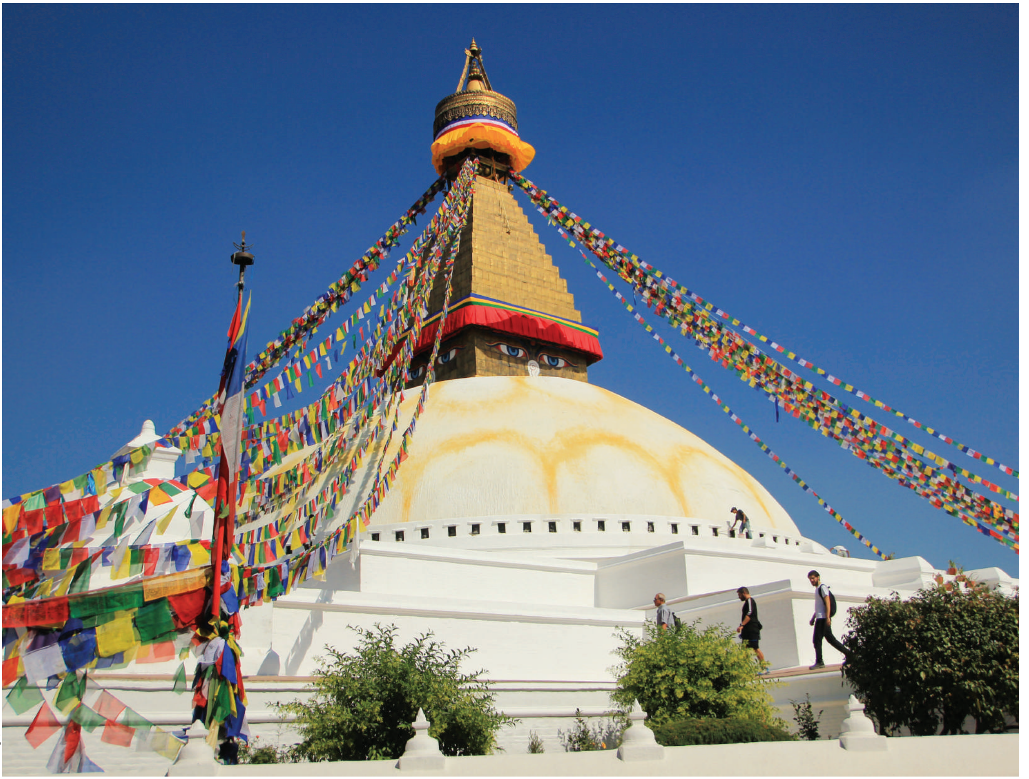
बौद्धनाथ स्तूप, काठमाडौं