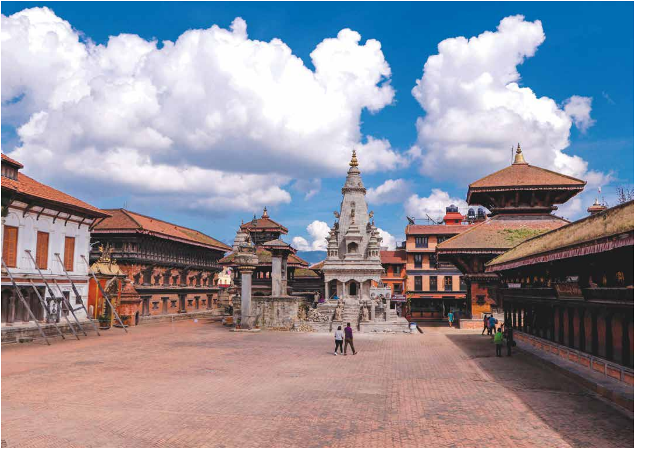
दरबार स्क्वायर, भक्तपुर