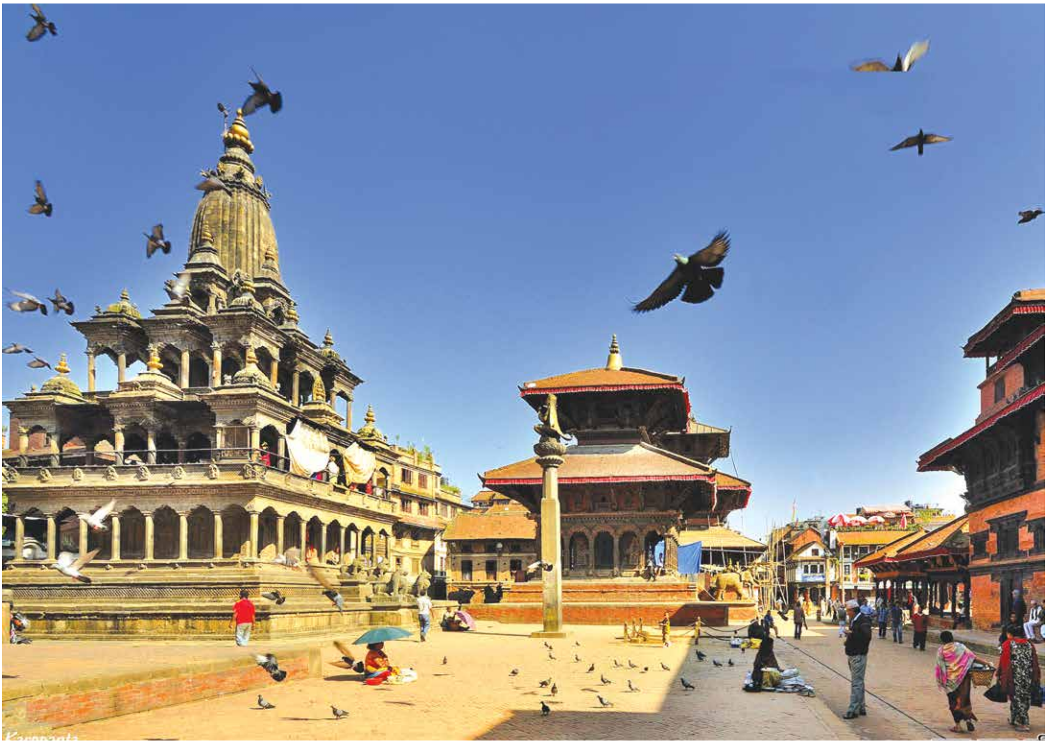
दरबार स्क्वायर, पाटन