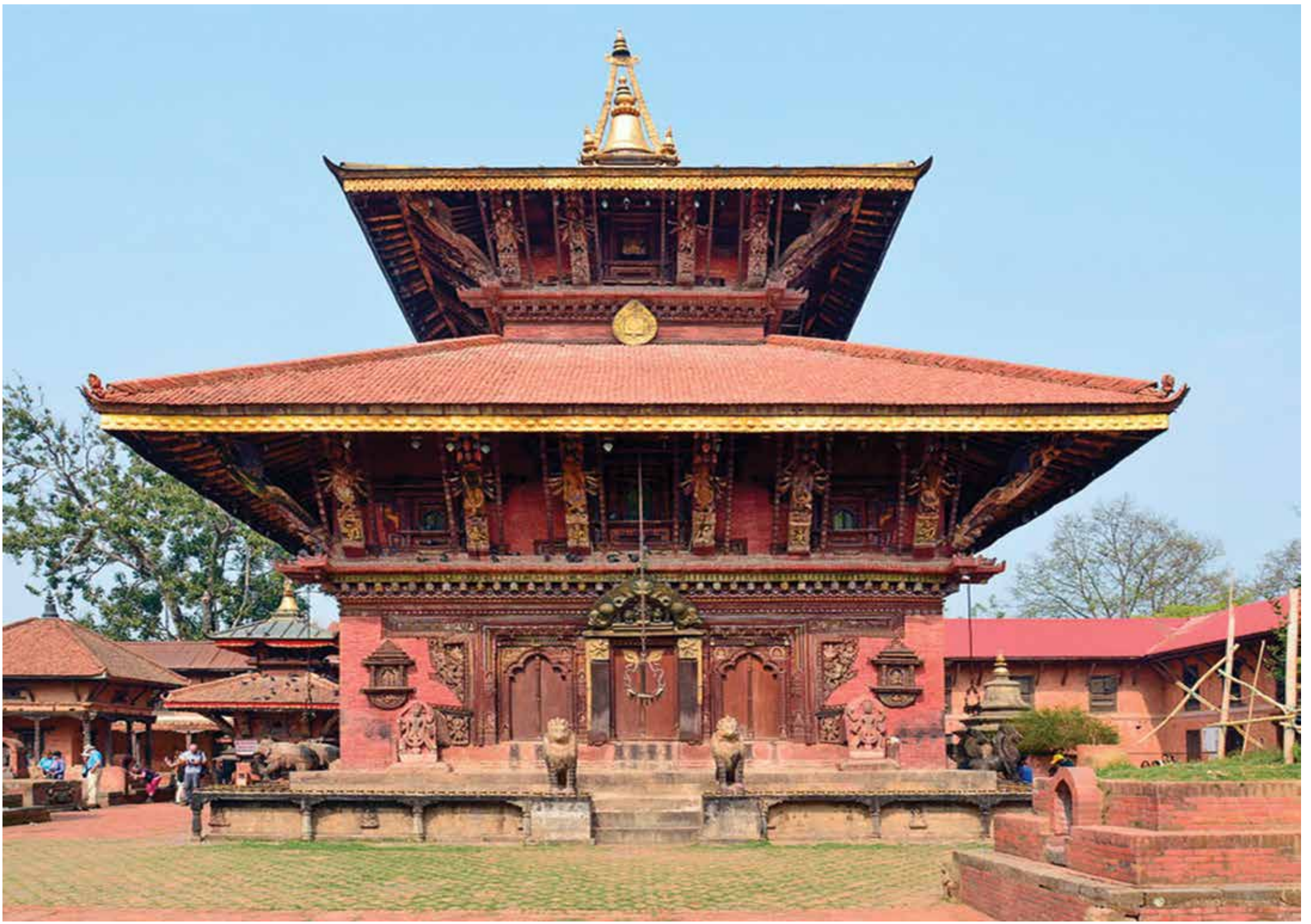
चाँगुनारायण मन्दिर, भक्तपुर